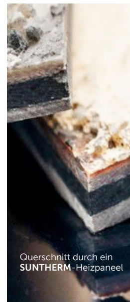
Querschnitt durch ein SUNTHERM -Heizpaneel